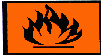
F+ EXTREMADAMENTE INFLAMABLE