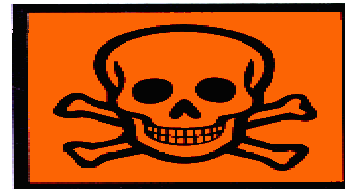
T+ MUY TÓXICO