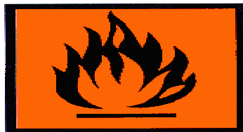
F FÁCILMENTE INFLAMABLE