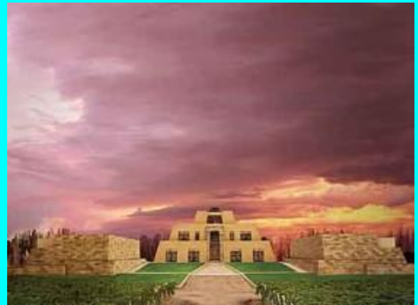
•Bodega Catena Zapata. Argentina